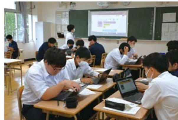
総合的な探究の時間